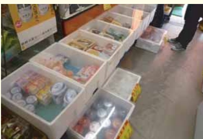
海辺の商店を探索する