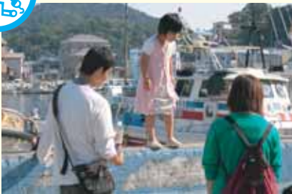
子どもと一緒に遊ぶ