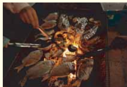
海鮮バーベキュー