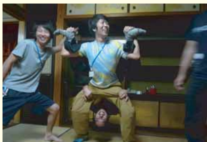
海辺の空き家の中で遊ぶ

いえしまの海辺ではいろんな遊びを実践できる。特に島の子どもたちは楽しい遊び方を良く知っている。釣りや磯遊びに加えて、漂流物探しもおススメだ。