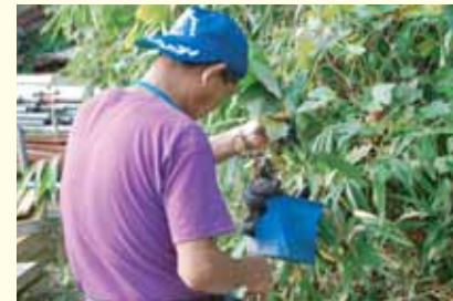
山葡萄をみつける