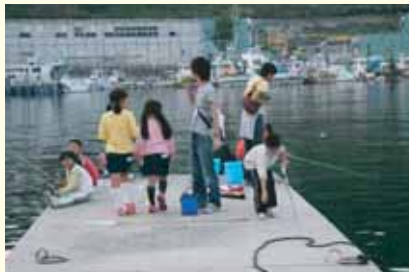
旬の魚を教えてもらう