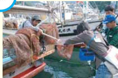
ワタリガニをもらう