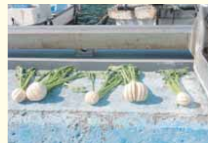
防波堤の上で干す野菜