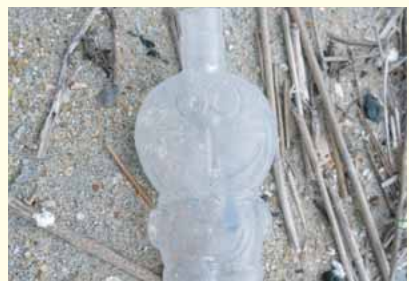
面白い漂流物を探す