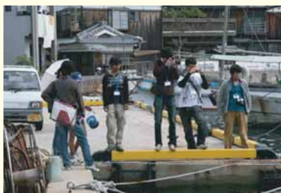
海辺の面白い風景を写真に撮る