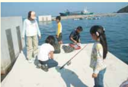
釣りのコツを教えてもらう