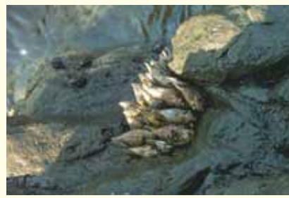
「亀の手」を見つける