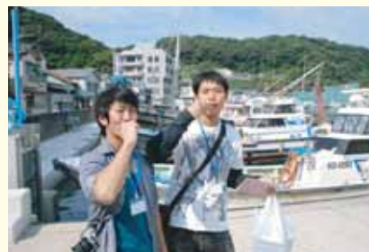
エビを生きたまま食べる