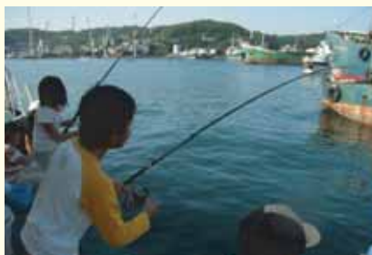
子どもたちと一緒に魚を釣る