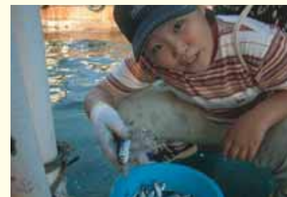
いえしまの子どもたちから魚をもらう

いえしまの海辺は食材の宝庫。運がよければ新鮮な海の幸を手に入れることができる。これらを海辺で食べることができれば最高だ。